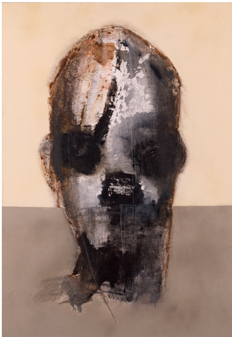
GIANLUCA VANOGLIO | SINDON, MOVIMENTO 4/5 | Tecnica mista su carta intelata