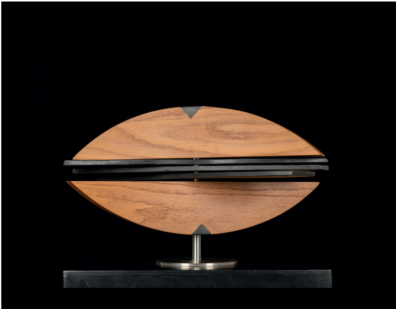
FABRIZIO PEDRALI | SIRIO | Legno di rovere ed ardesia