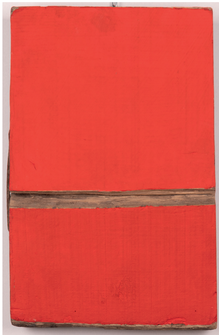
CESARE GIUDICI | ROTTURA | Acrilico su legno