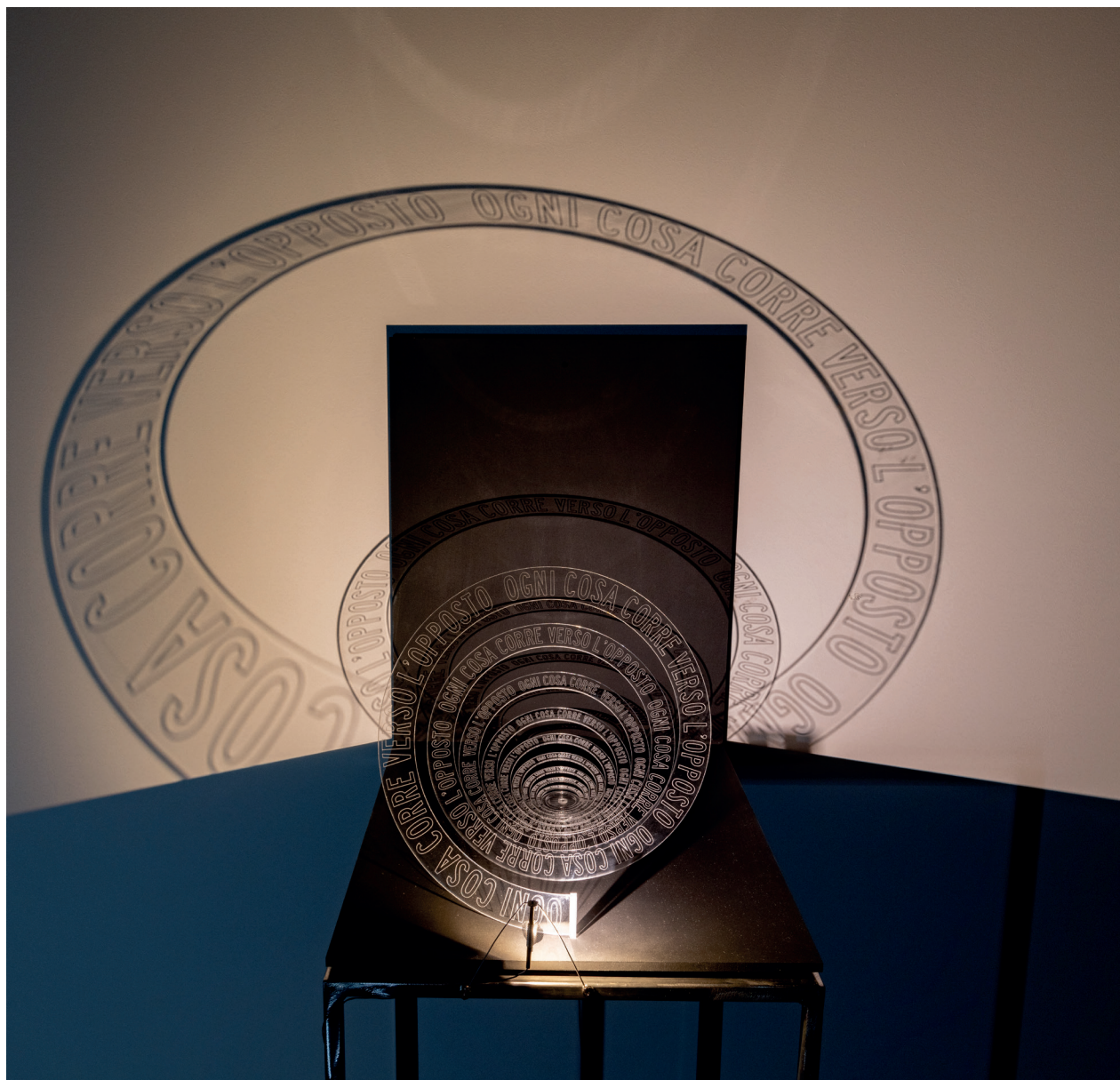
CARLO BENVENUTI | ENANTIODROMIA | Installazione in plexiglass su pannelli MDF