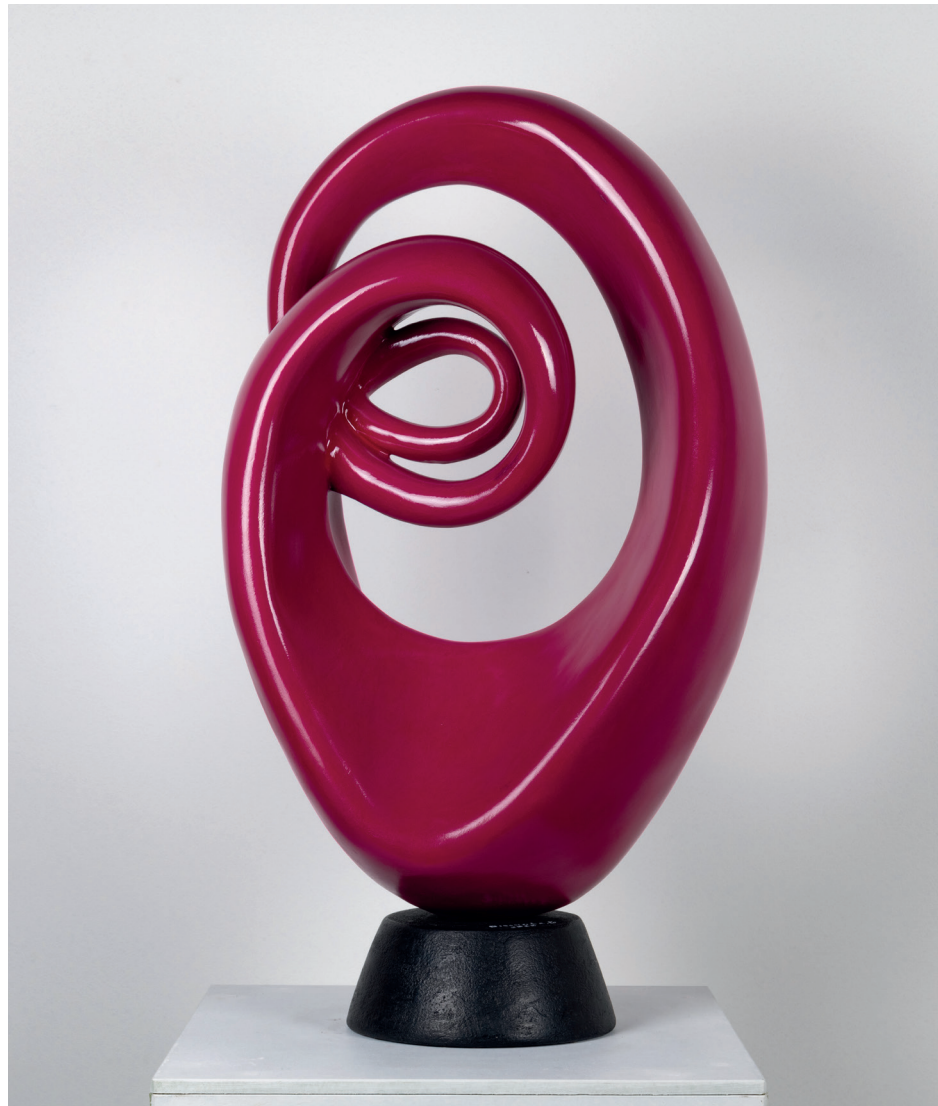
GIANLUIGI BISCUOLA | ASCOLTANDO L'ANIMA 6 | Polistirene e gel adesivo strutturale