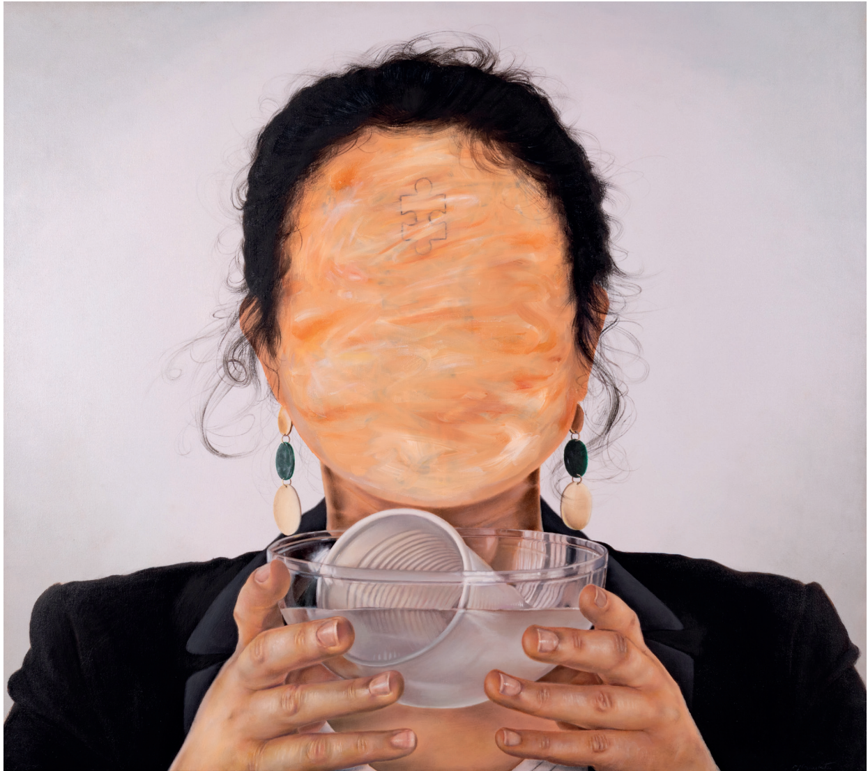
FRANCESCO SGARLATA | UTOPICO/DISTOPICO#1 (Puoi inquinare in qualsiasi modo purché sia ecologico) | Olio su tela