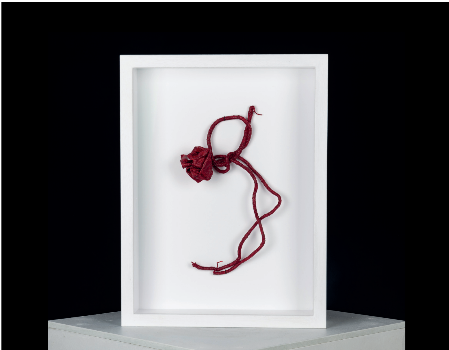
SERENA NICOLÌ | BEAUTIFUL CHILD | Spago, tessuto, gesso, vernice e pigmento acrilico