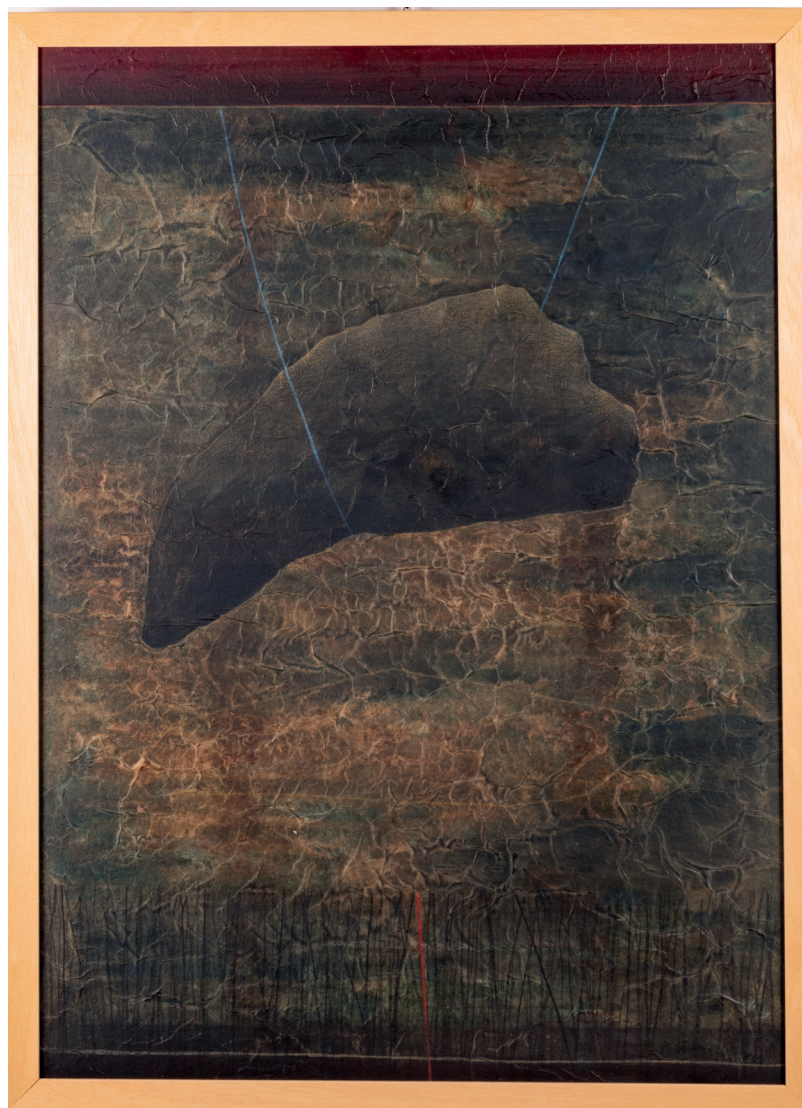
FEDERICO BASSI | I.P.D.B.22 (Insostenibile Pesantezza Del Benessere 2022) | Tecnica mista su tela