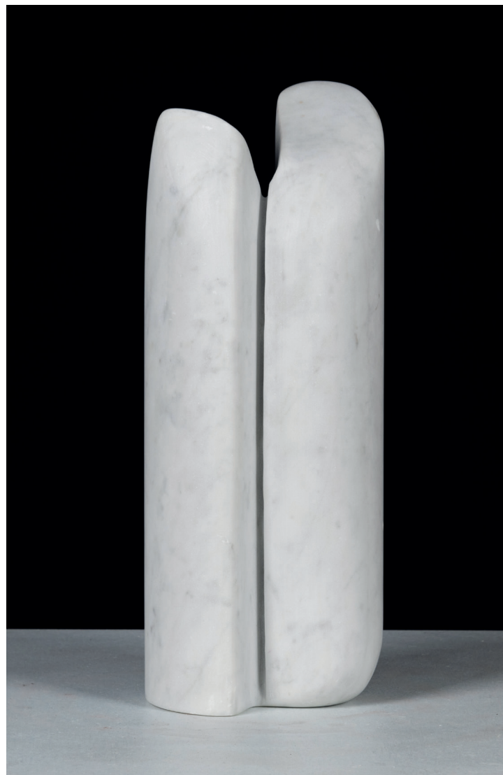
FRANCESCO FAI | ABBRACCIO | Scultura manuale in marmo