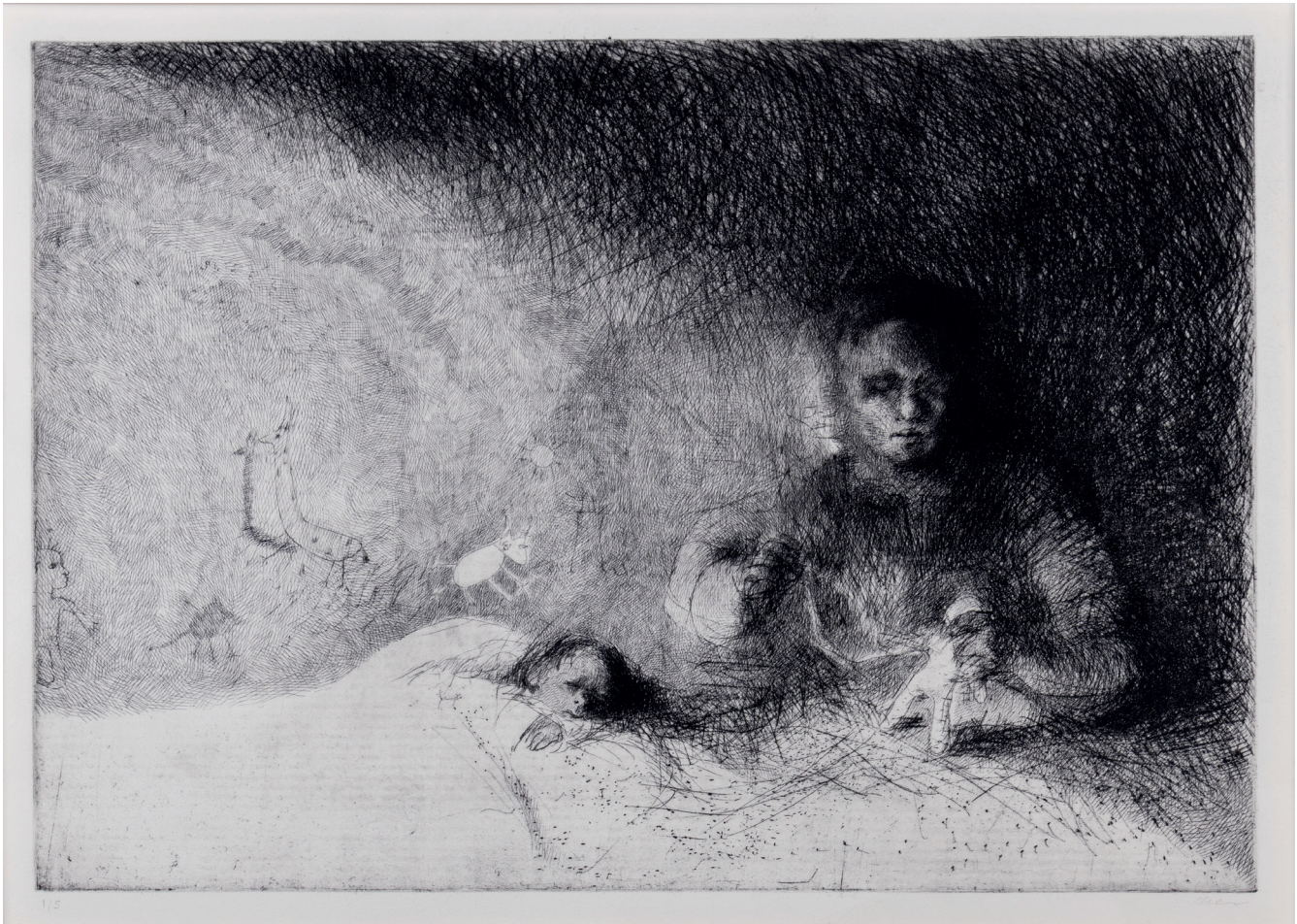
ANNA COCCOLI | DONNA CHE CUCE | Calcografia stampa d'arte, cera molle, acquaforte e bulino