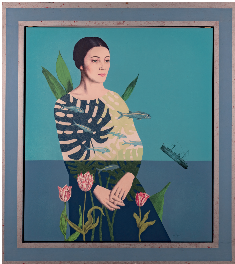
LAURA ZANI | RITRATTO DI UNA SIRENA | Tecnica mista su tela